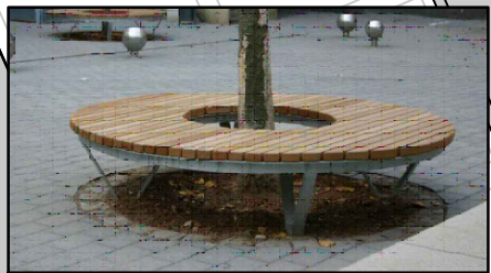
Rundbank um Baum (z.B. Fa. Nusser)