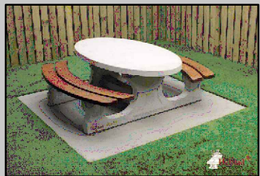
Bank-Tisch-Kombination (z.B. Fa. Heblad)