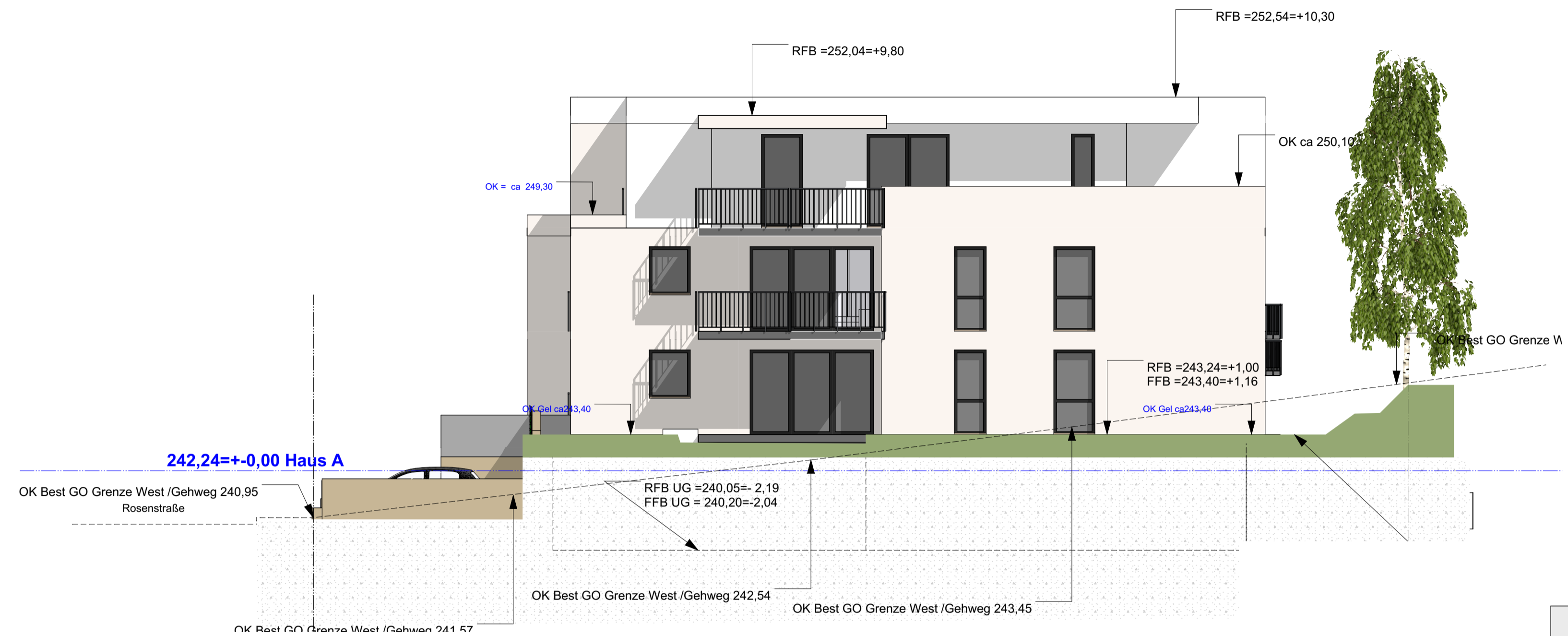
WEST Haus B